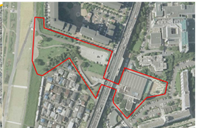
淀川河川公園守口地区と 地区内の守口スポーツプラザ