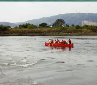
流れの速い三川合流付近