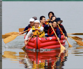
枚方のゴールは目の前！