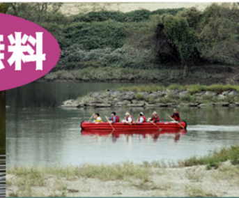
水制工やわんどを過ぎる