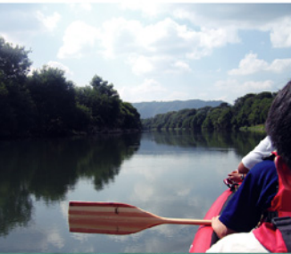
スタートは宇治川