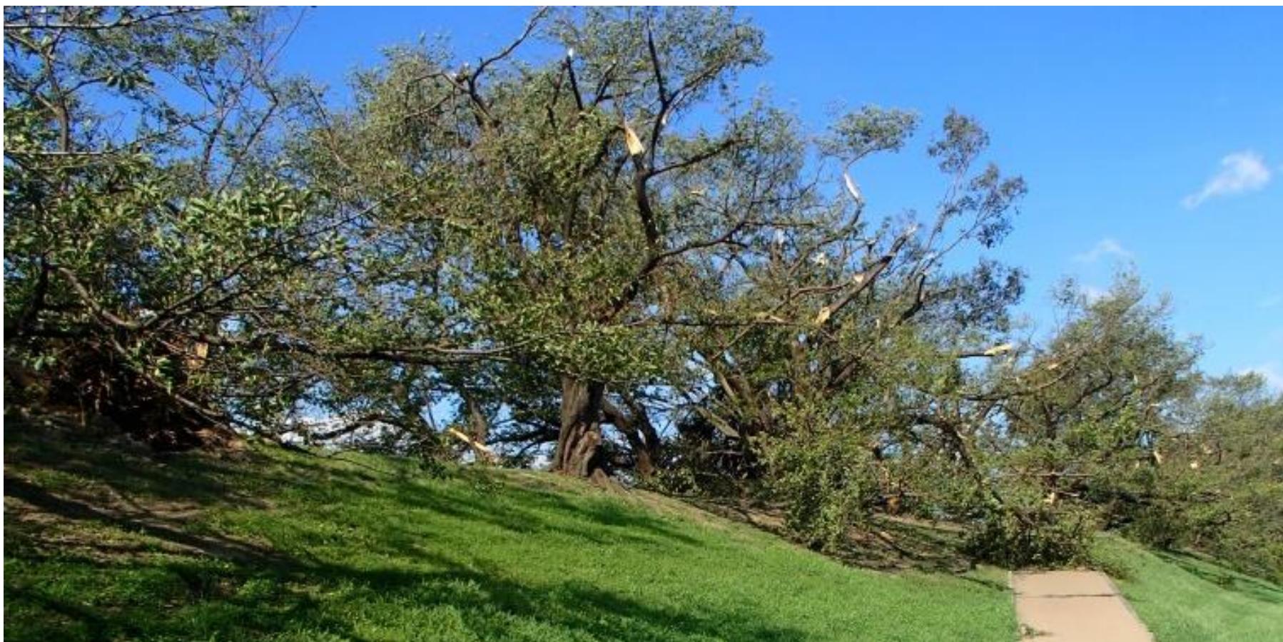
▲木津川側の倒木状況（下流から上流方向）