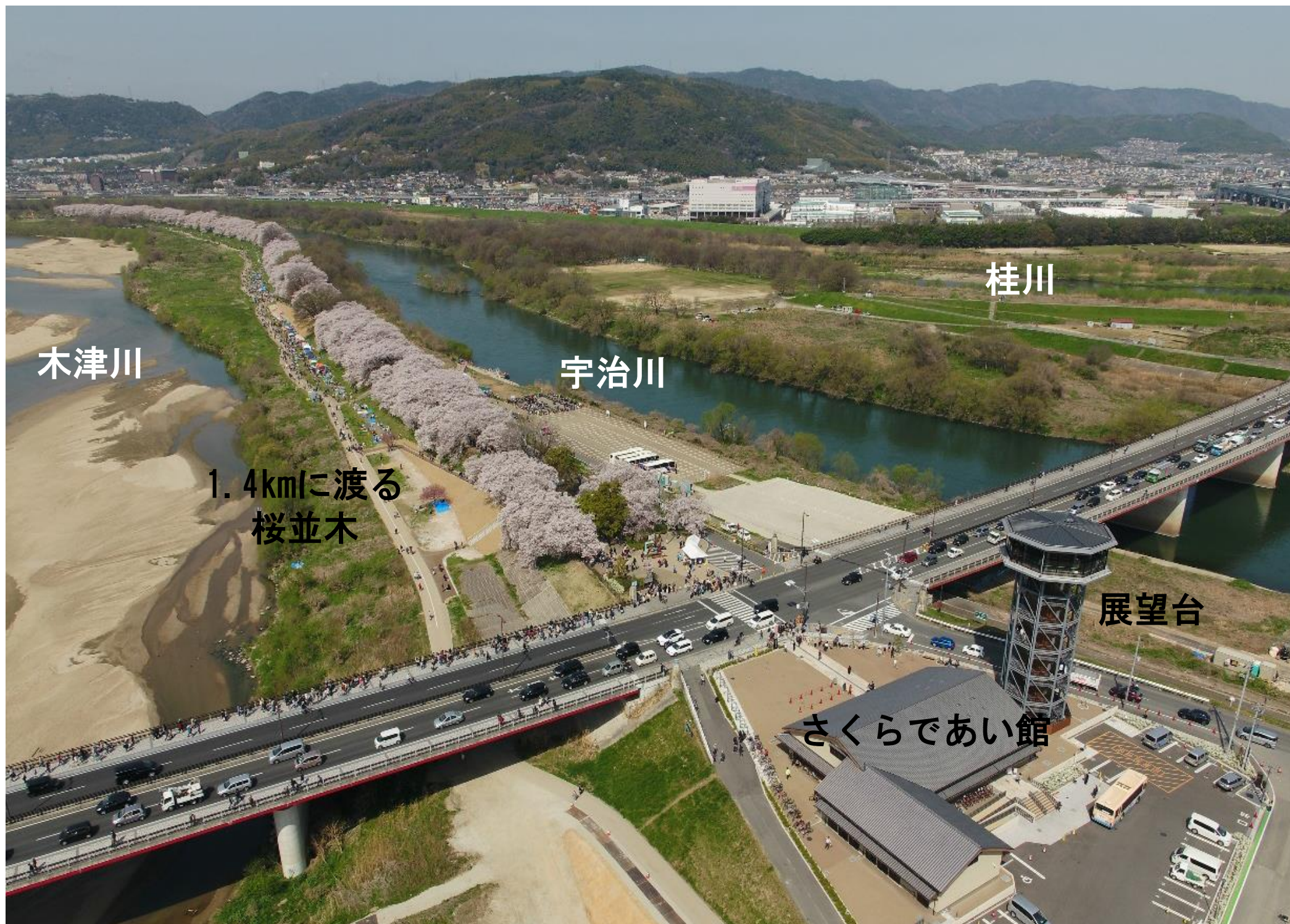
▲御幸橋上流側から下流方向を望む（H30.4）