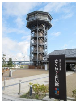
(ご参考)12/13(木)10時頃撮影