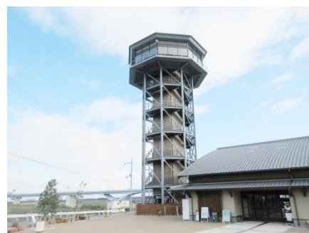
(ご参考)12/13(木)10時頃撮影

貴社におかれましては、日頃より淀川河川公園の広報にご協力いただき、誠にありがとうございます。