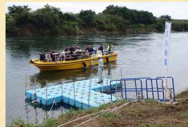
▲三栖閘門仮設船着場 (イメージ)