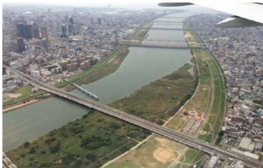
柴島干潟や防災船着場などを見学 運が良ければボラのジャンプが見られるかも！