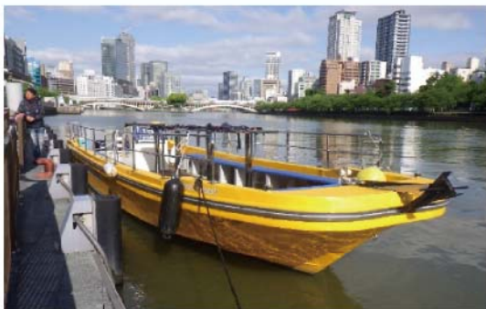
この船に乗って行くよ！ 水切天神（トイレ付）